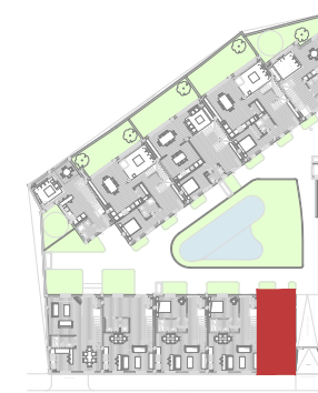
PASEO DE LOS CANÓNICOS