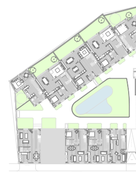
PASEO DE LOS CANÓNICOS