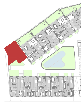
PASEO DE LOS CANÓNIGOS